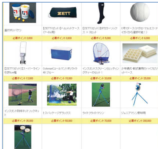
ポップポイント交換商品ページ一例